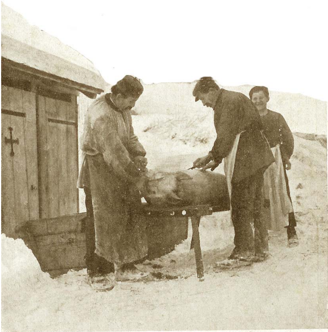
947. — Croquis villageois. Le dernier jour d'un condamné